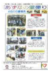
「あすなの家・里お便り」

月間スケジュールや、毎日の健康状態を表した「健康グラフ」、「健康生活プログラムシート」、ご利用様の日々の生活の様子・四季折々のイベント風景などが掲載された「あすなの家・里お便り」を毎月お届けいたします。