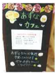
あすなの里カフェ

毎週日曜日の午後は、ご利用様がゆっくりと会話を楽しめる時間をつくり、週替わりでのお飲物(コーヒー・紅茶・日本茶など)とお菓子を頂く「茶話会」を行っております。