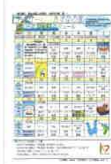
「あすなの家・里月間スケジュール」