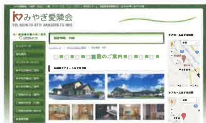
みやぎ愛隣会 検索

各施設の詳細につきましては、ホームページよりご覧頂けます。また、ご利用のご家族様には、ご利用様の日々の活動の様子や、季節に応じたイベントの様子を「ご家族様専用ホームページ」よりご覧頂けます。