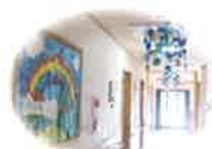
明るく開放的な廊下