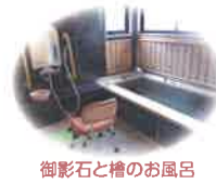
御影石と檜のお風呂