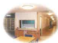
安らぎと温もりの談話室