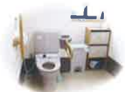
スライドドアの 広々トイレ