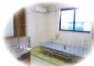
洗面・トイレ完備の居室