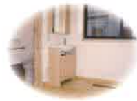
木の温もりを感じる居室