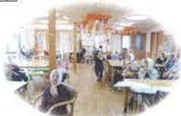
明るい光に包まれたダイニング

「住み慣れた地域で心の温もりを感じ、 安心・安全で快適な暮らし」をサポートいたします。