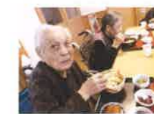
新そばパーティー