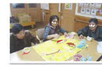
手芸・工芸クラブ