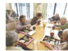
行楽弁当パーティー