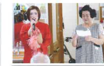
誕生会(スタッフ余興)